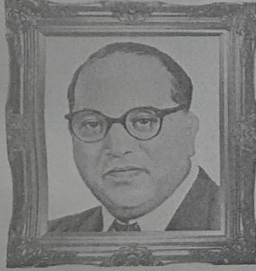
डॉ. बाबासाहेब आंबेडकर