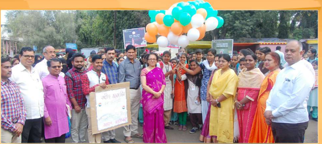
राष्ट्रीय मतदार दिन - मतदार जागृती रॅली