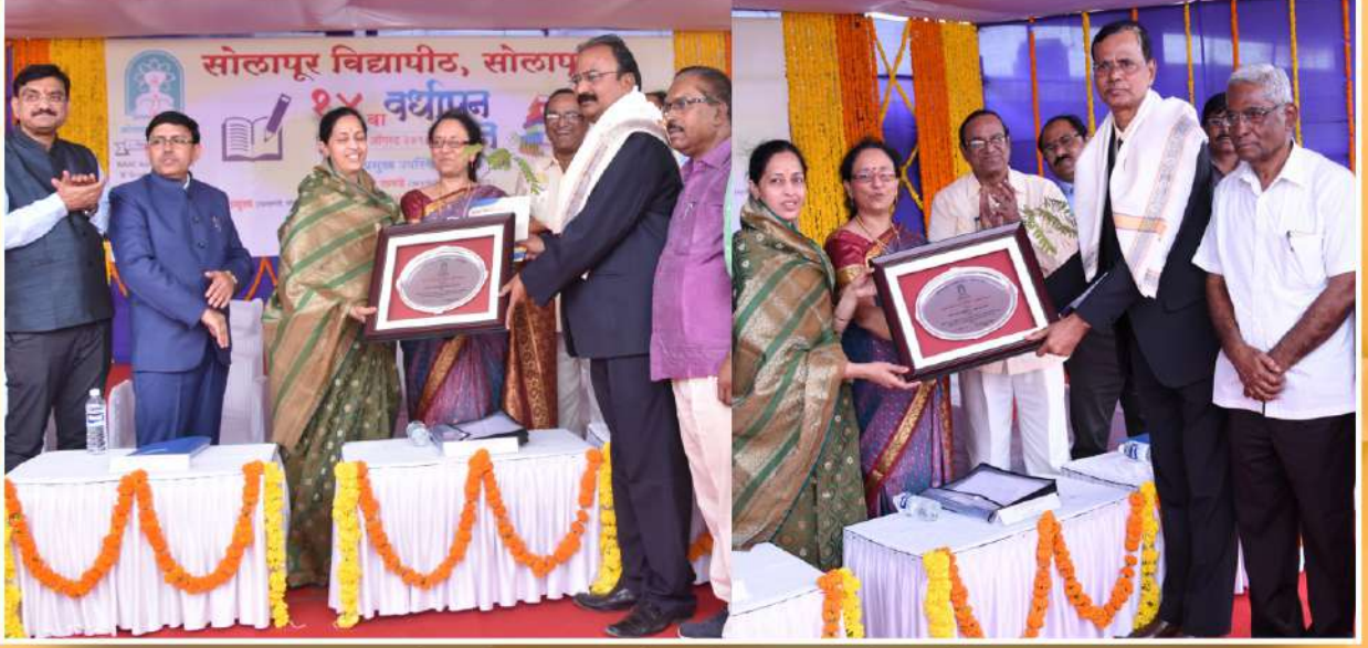
उत्कृष्ट महाविद्यालय (शहरी) लक्ष्मीबाई भाऊराव पाटील महिला महाविद्यालय, सोलापूर