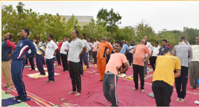
आंतरराष्ट्रीय योग दिवस प्रशिक्षण कार्यक्रम