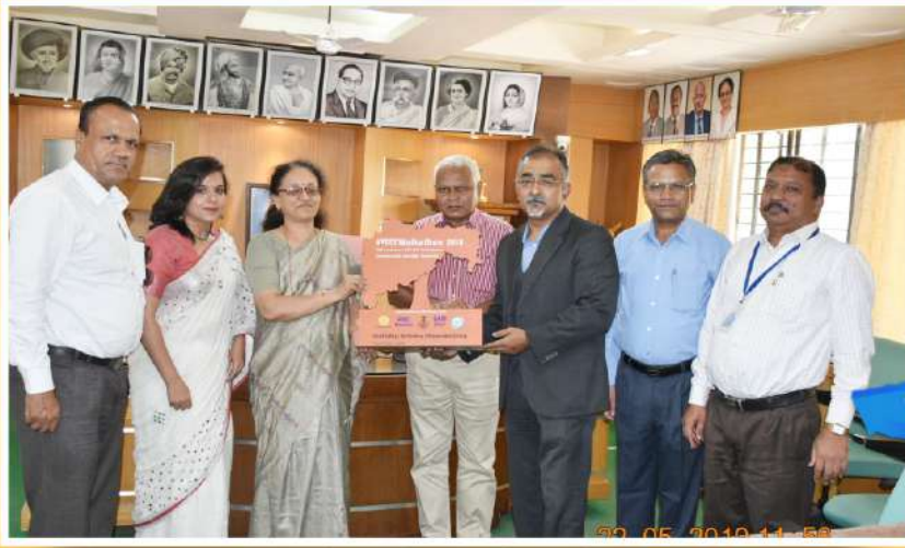
महा WALKATHON 2018