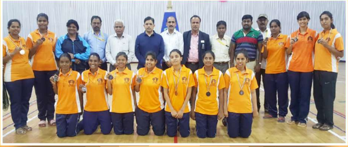
महाराष्ट्र राज्य आंतर विद्यापीठ क्रीडा महोत्सव स्पर्धा - २०१८ यामध्ये बास्केटबॉल (मुली) संघाने कांस्यपदक प्राप्त केले.