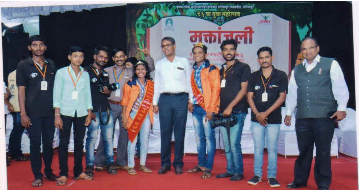
विपीठाच्या युवा महोत्सवात गोल्डनगर्ल व गोल्डनबॉयचे पारितोषिक मिळविणारे विद्यार्थी त्याचे प्राचार्य